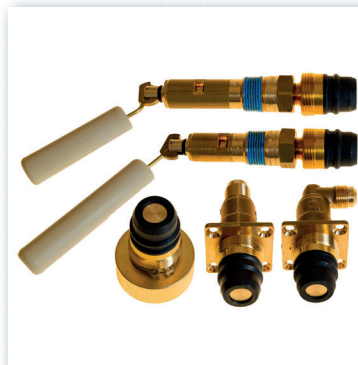
Füllstopp und Adapter