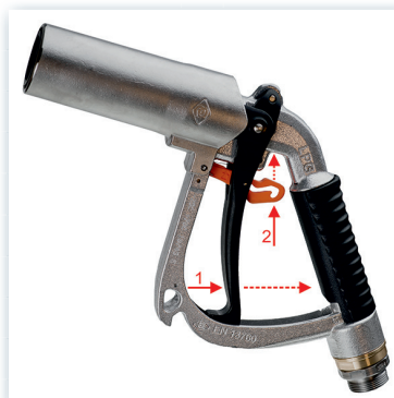
Verriegeln der Zapfpistole

Den Anschluss erhalten Sie bei Tyczka Energy als Nachrüstsatz GAZTEC Adapter auf ACME oder als OEM Armatur mit 80 % Füllstoppventil.